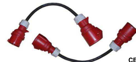
CEE16 400V / 16A - 11kW

Weitere crOhm Ladestationen finden Sie unter www.crohm.ch